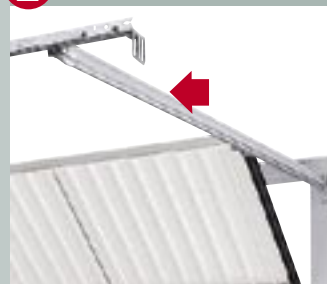
2 Biztos sínvezetés

A kapulap kisiklását a precíz sínvezetés akadályozza meg.