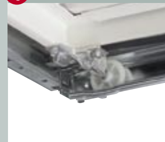
4 Végállás biztosítás

Felsővégállás biztosítással a kapu biztonságosan nyugalmi állapotba kerül.